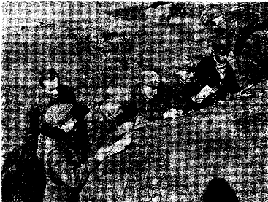
2. Описмењавање на фронту; борци 5 козарске (крајишке) НОУ бригаде уче се писању и читању у рововима Срема