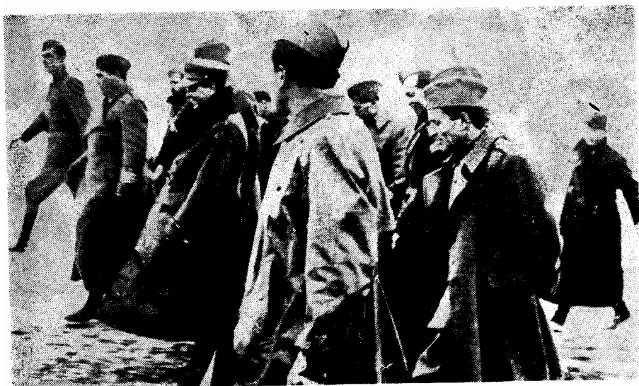
3. Врховни командант НОВ и ПОЈ маршал Тито с члановима Штаба 1 армије НОВ у обиласку Сремског фронта, 16. јануара 1945. године