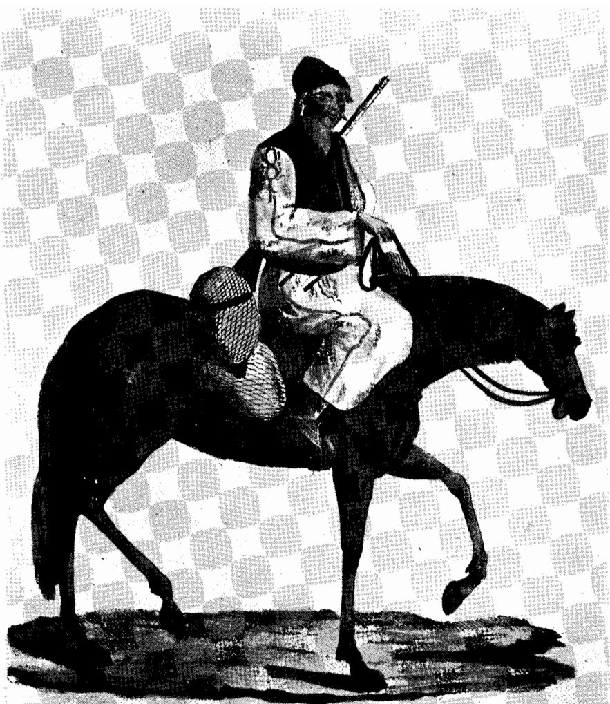
Türkischer Emigrant von Mirna aus Servien

Сл. 4 — X. Лешенкол: Српски сељак из Мирнице, 1790.