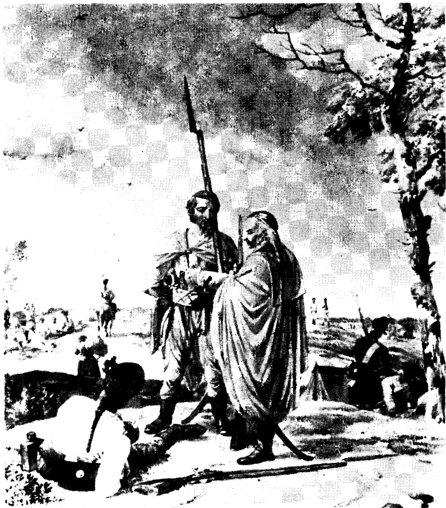
Сл. 5. Вилхелм Кобел: Срби-војници Вурмзеровог фрајкора (Акварел, Војноисторијски музеј у Бечу)