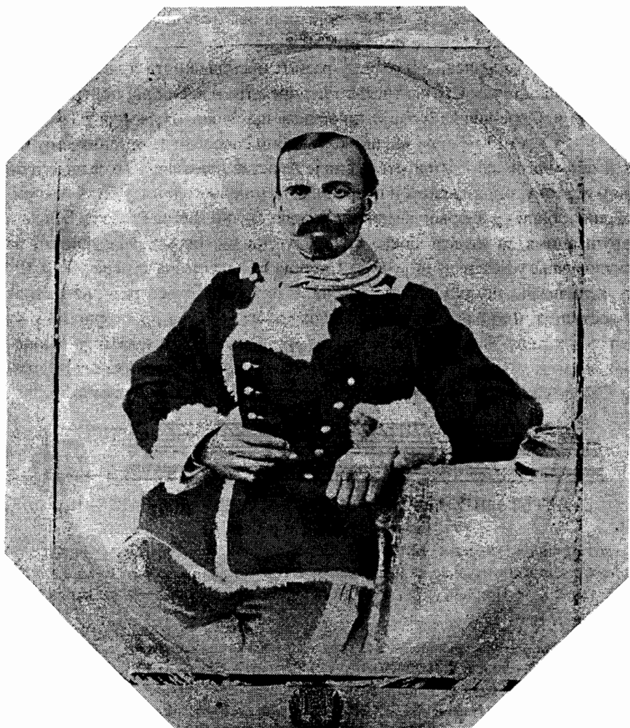
Портрет Милоша Ј. Обреновића, снимак увећања са детаљима предлошка на којем је каширан.