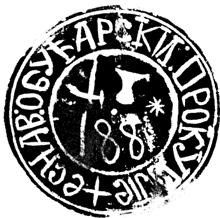
Печат Обуварског еснафа из Прокупља