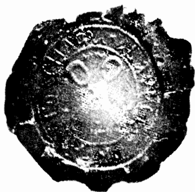
Печат Абазијског еснафа из Београда