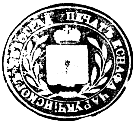
Печат Чаругијског еснафа из Београда