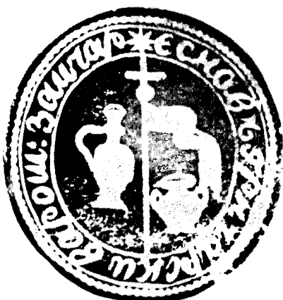
Печат Гричарског еснафа из Зајчара