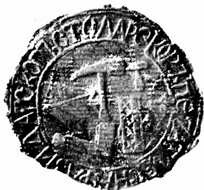
Печат Дуњерско-столарског еснафа из Обреновца