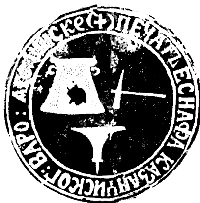
Печат Казанијског еснафа из Јагодине