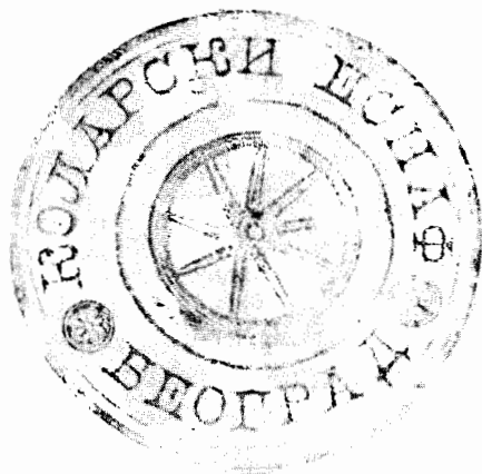
Печат Коларског еснафа из Београда