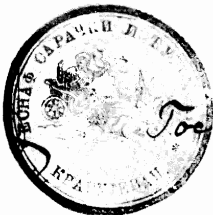
Печат Сарачко-хурчијског еснафа из Крагујевца