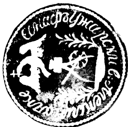
Печат Ужарског еснафа из Алексинца