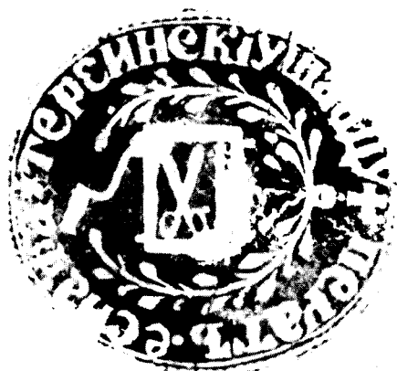
Печат Терзијског еснафа из Шапца