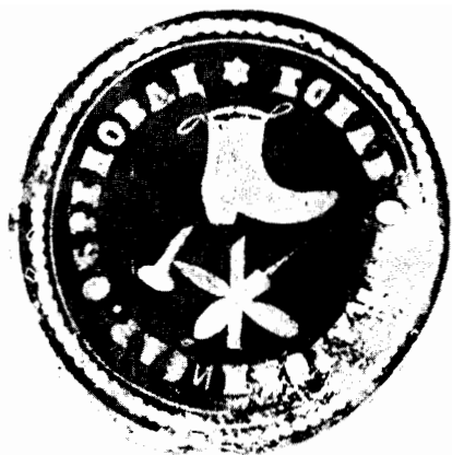
Печат Обујарско-сарачког еснафа из Обреновца