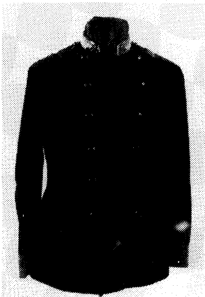
Мундир пешадијског пуковника кнеза Милана Обреновића IV

КОМОДА, ДЕО САЛОНСКЕ ГАРНИТУРЕ ИЗ ДВОРА МГБ, инв. бр. УСН 64