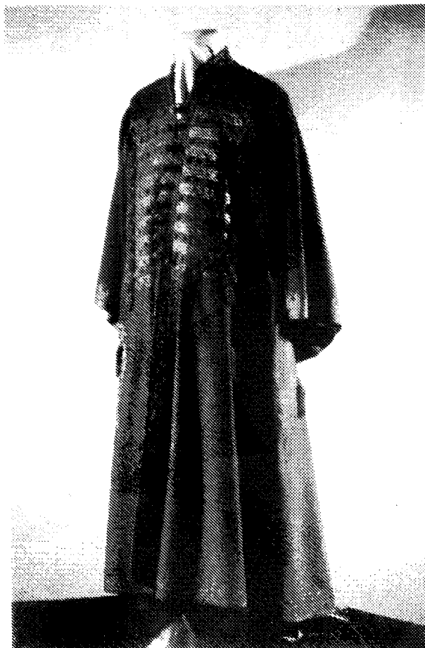
Пурк кнеза Михаила