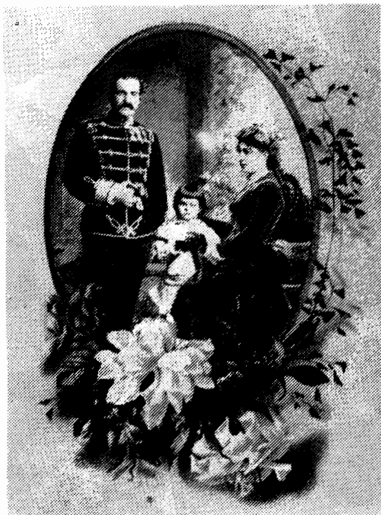
Краљ Милан, краљица Наталија и син Александар, рад Милана Јовановића