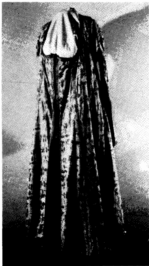
Фистан књегиње Јулије