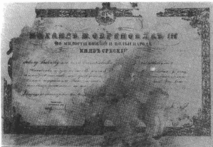
Указ о додели Таковског крста из 1865. г.

Самим чином обнове Таковског крста, као ордена, 1876. године и она јубиларна споменица, као његова претеча, добила је карактер ордена и тре-