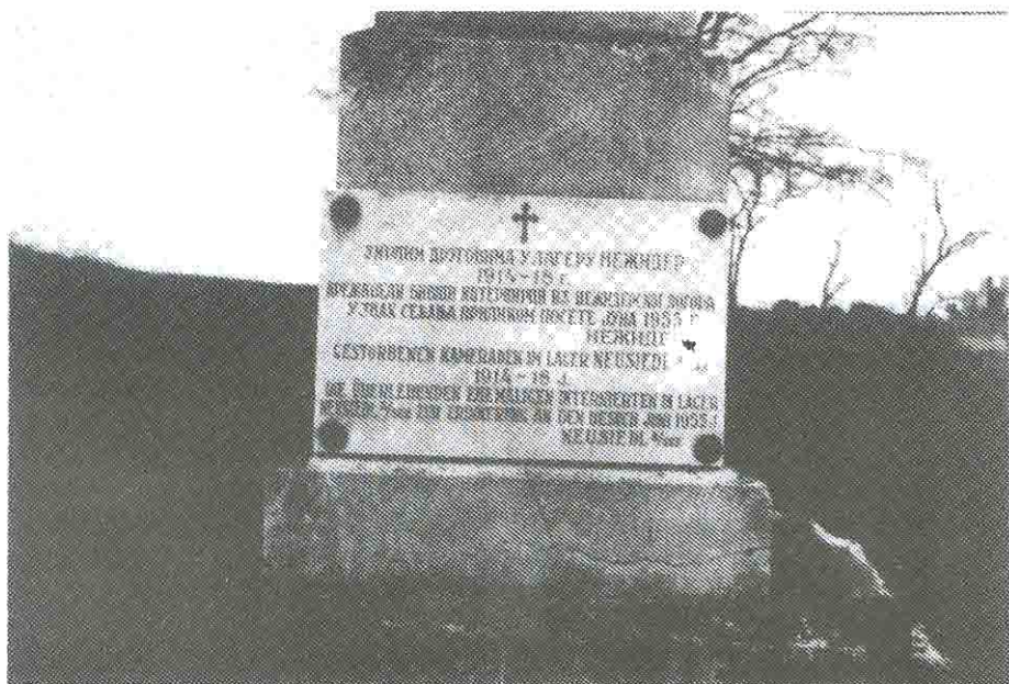
Два снимка сѐменика српским жрѣвѣма у нежидерском логору из Првог свейског рата, данас њошћављен у месном гробљу Нојзидл ам зе