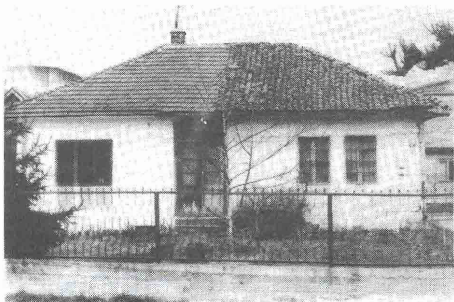
Кућа која је сачувана изод заштити као кућа Јеврема и Свешозара Марковића у Јагодина (данашњи изглед)