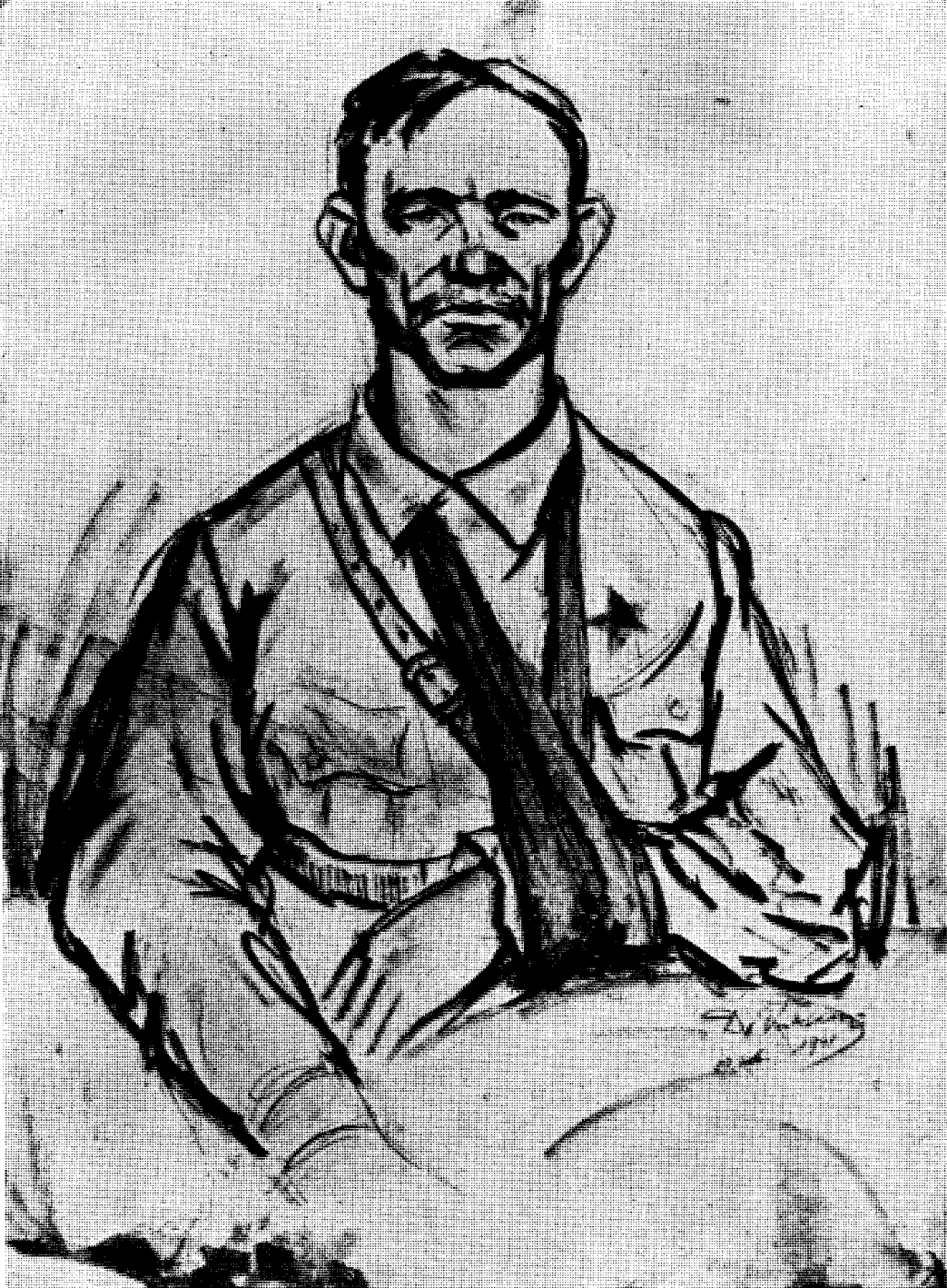
Драгољуб Вуксановић: Рањени борац (1941)