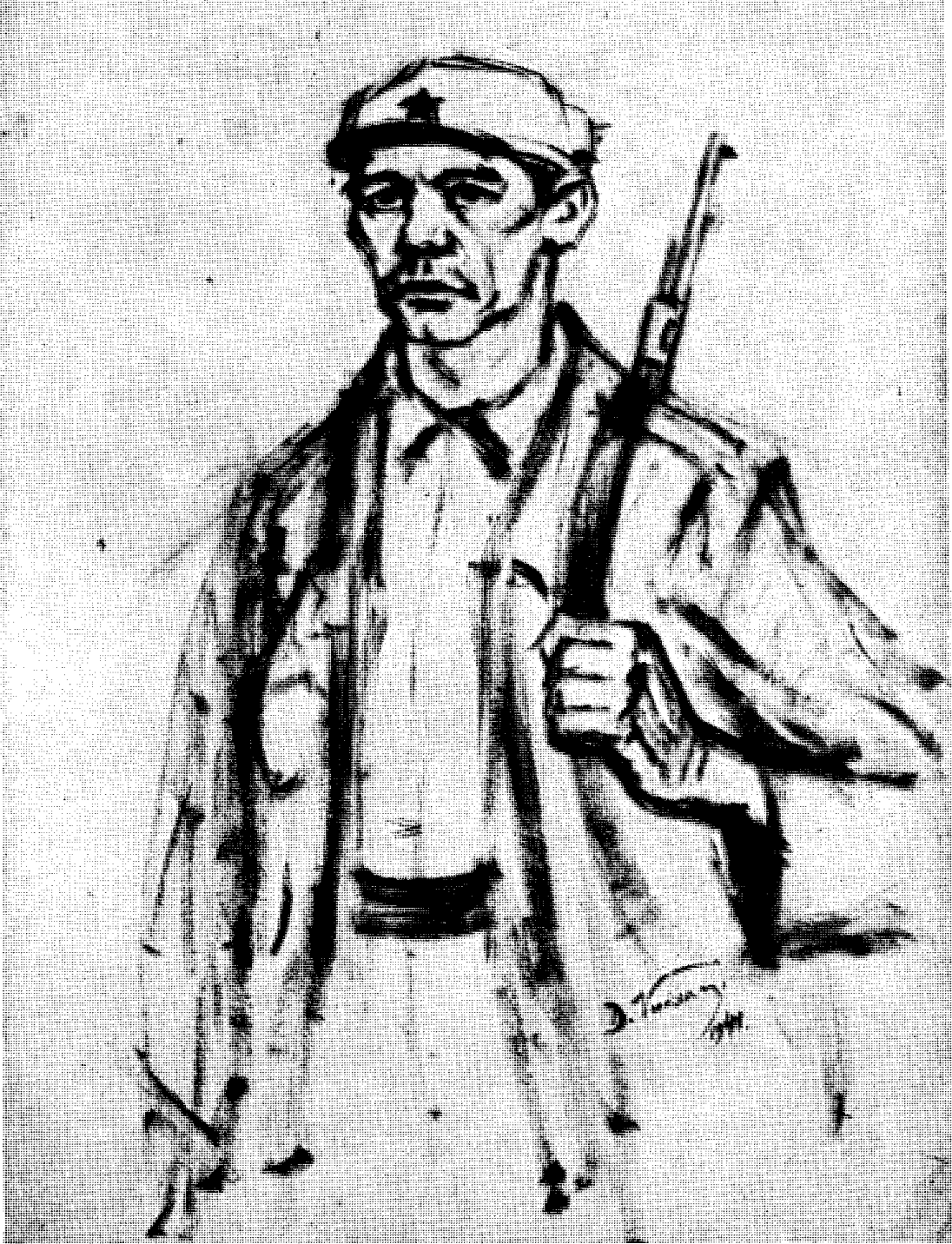
Драгољуб Вуксановић: Борац Радничког батаљона (1941)