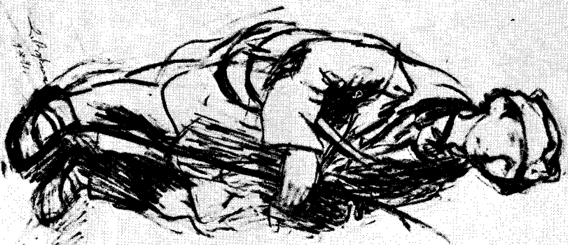
Драгољуб Вуксановић: Мали курир Миша (1941)