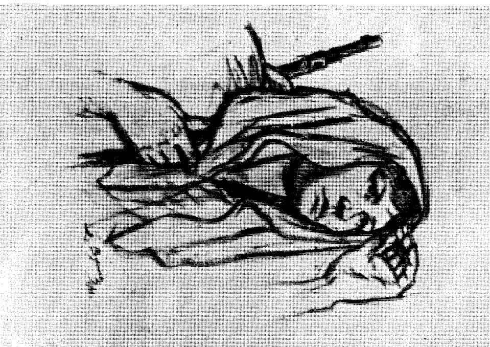
Д. Вуксановић: Партизанка из ужичког краја (1941)