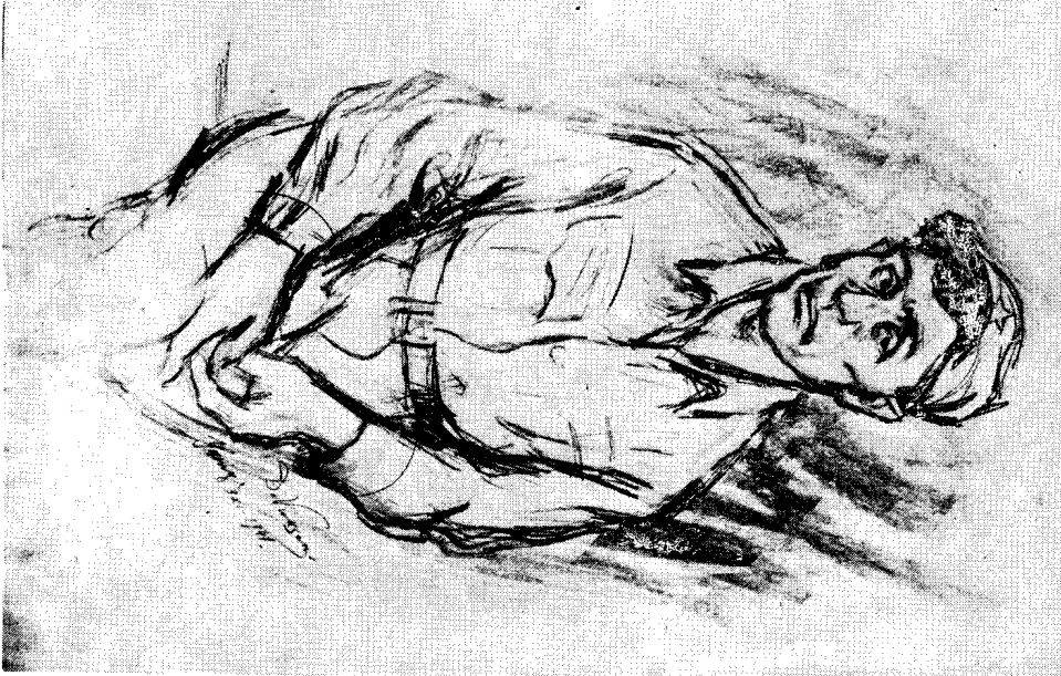
Драгољуб Вуксановић: Борач (1941)