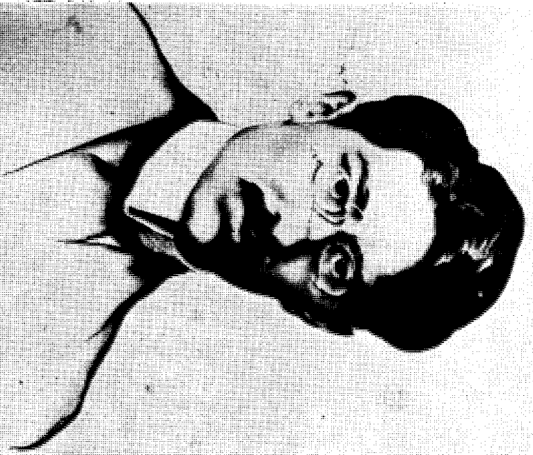
Божидар Јаќац: Душан Поповић