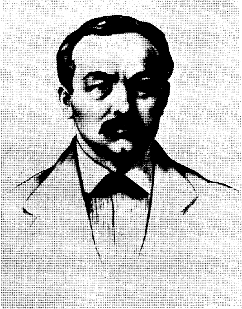
Божидар Јакац: Димитрије Туцовић