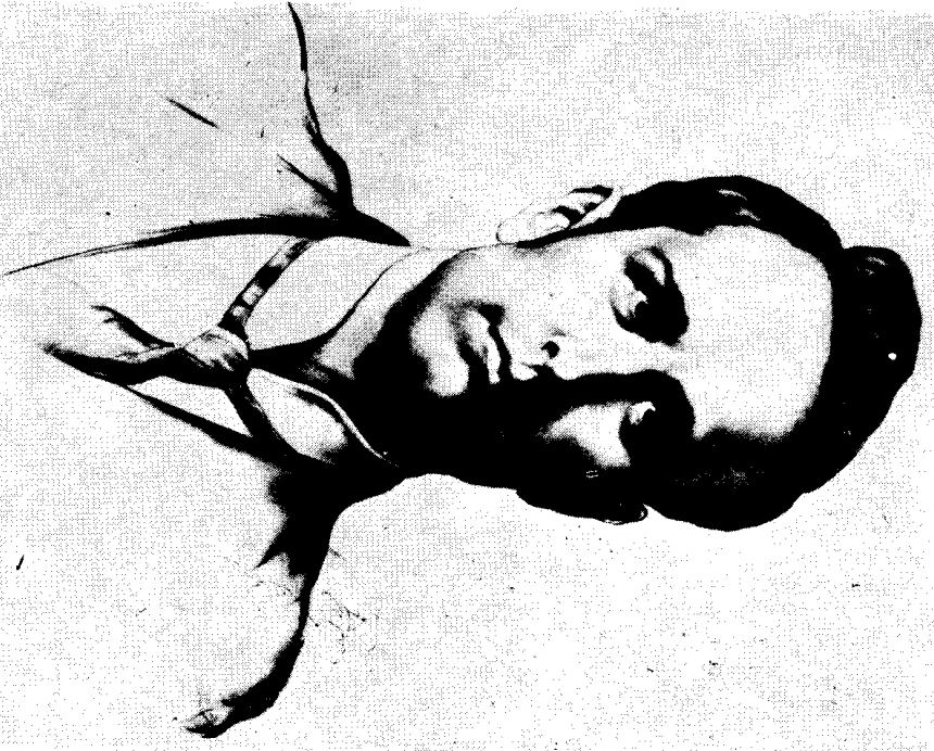
Божидар Јаќац: Радован Драговић