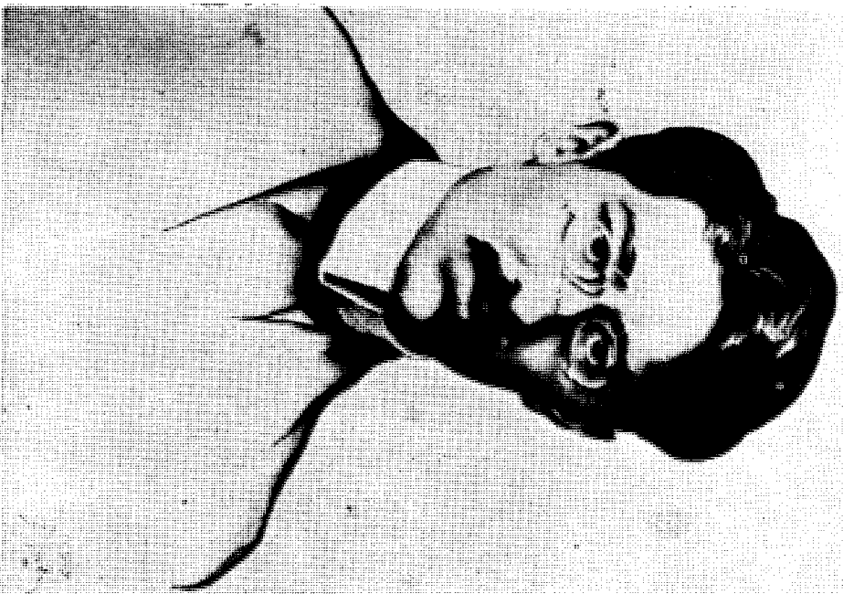
Божидар Јакац: Душан Поповић