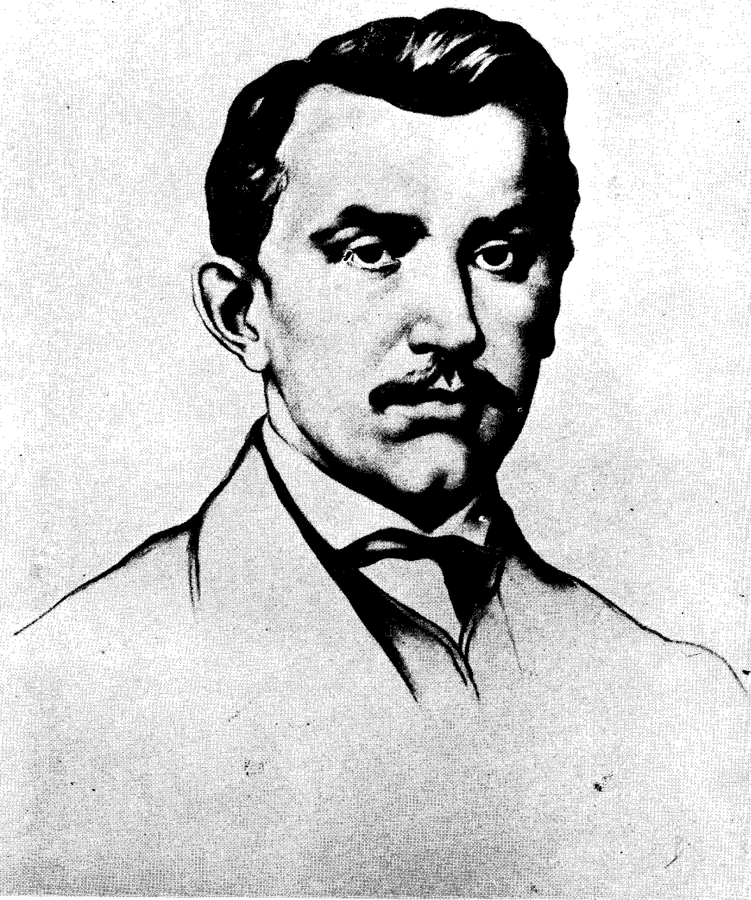
Божидар Јакац: Светозар Марковић