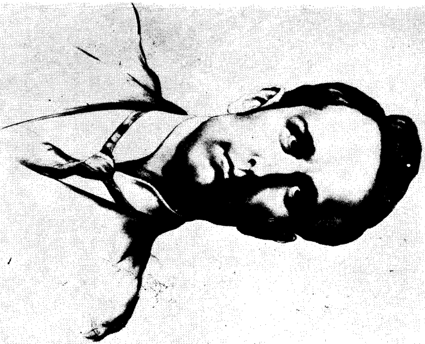
Божидар Јакац: Радован Драсковић