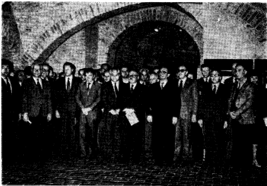
Отварање изложбе у Београду

Маркс је живео, радио, писао и борио се у одређеним историјским и друштвеним условима. Била је то ера суровог, предимперијалистичког капитализма, када је ослобођење од феудализма