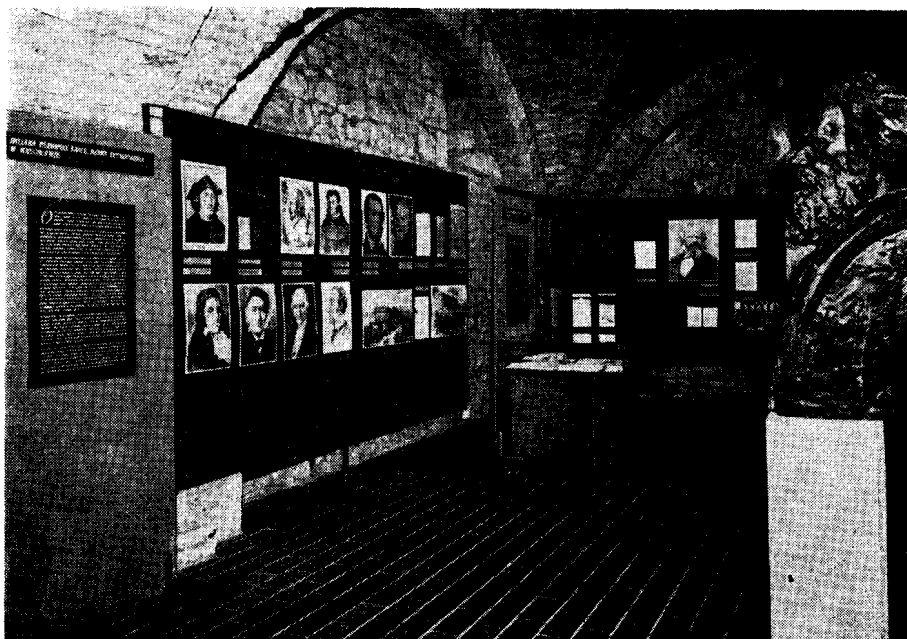
Снимак поставке изложбе у Београду у згради Конака кнегиње Љубице