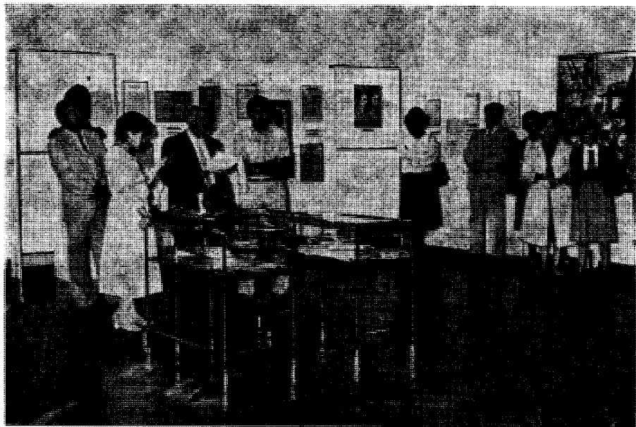
Отварање изложбе у Новом Саду у сали Војвођанског музеја

нову класу пролетаријат, који је у том процесу настајао, чврсто везивало и супротстављало новој класи експлоататора, која је била носилац борбе за рушење феудалних окова друштвених развоја. Имајући и то у виду треба рећи — ко у Марковом делу тражи