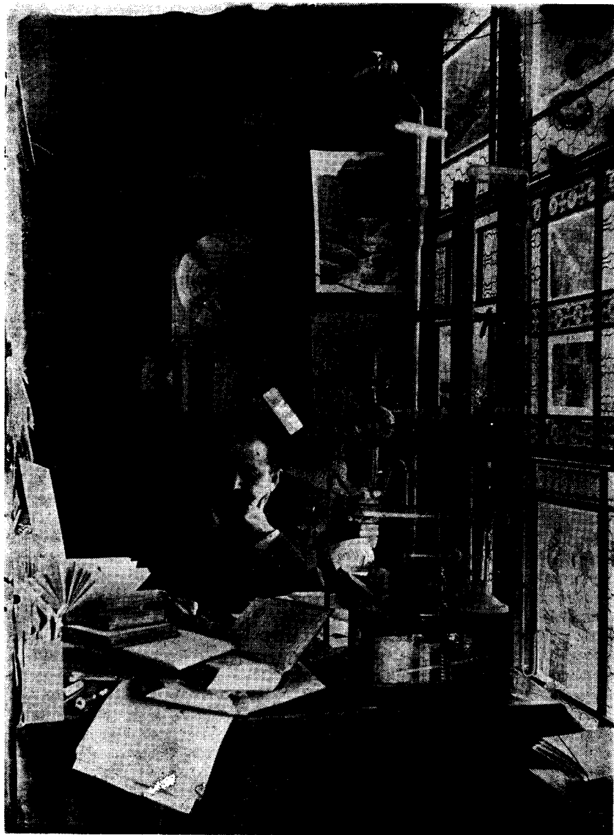
Професор Борбе Станојевић у свом кабинету

Својим знањима и схватањем значаја научног прогреса био је испред многих својих савременика. Стога није случајно што му француска Академија наука поверава научну експедицију за проучавање помрачења Сунца у Русији 1887. године, а суделовао је и у физичко-научној експедицији за проучавање Сунца и термичког