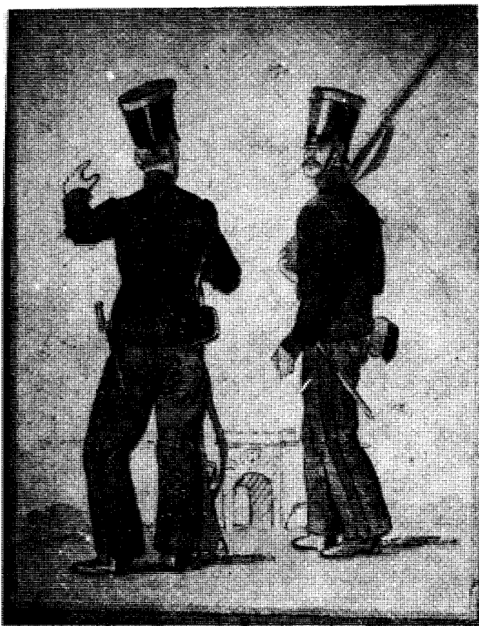
Униформа српских регуларних војника у Београду 1809. по опису тумача А. Агамала Акварелисани цртеж П. Васића