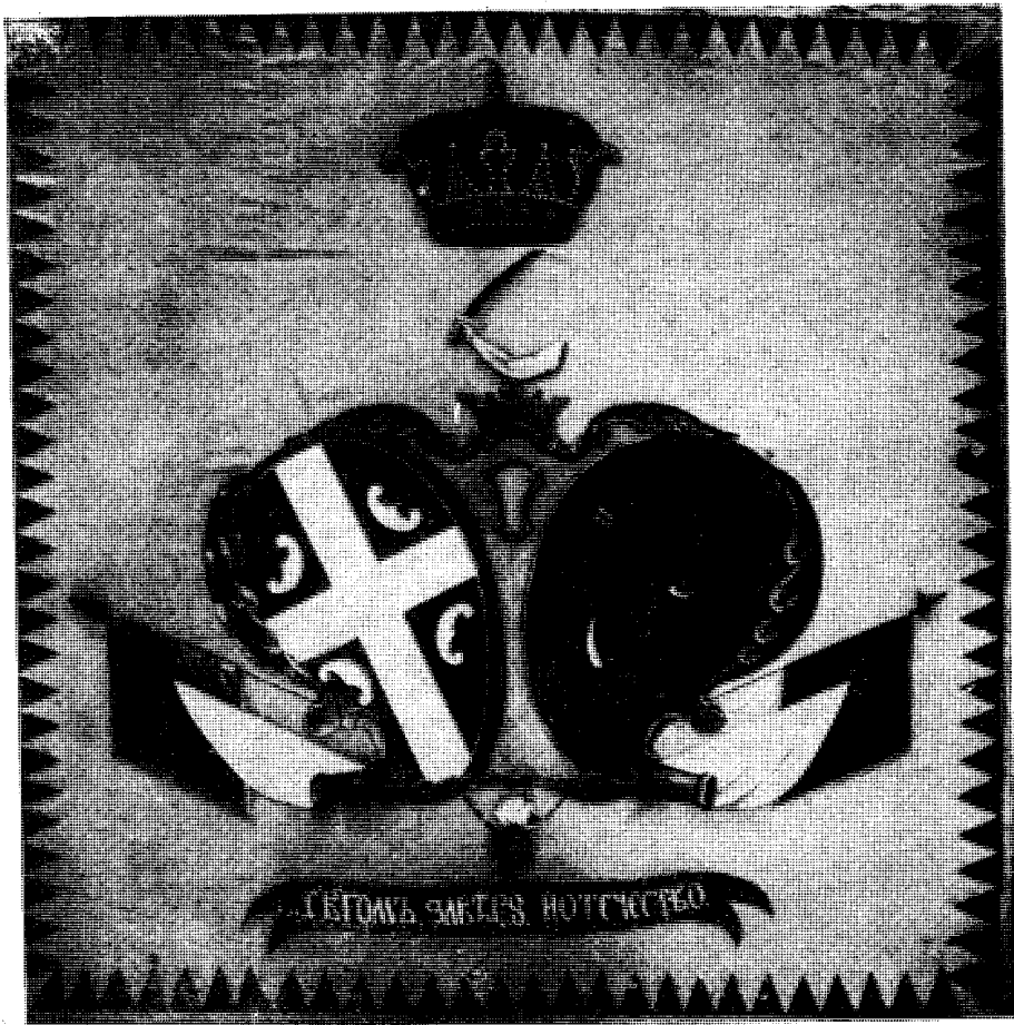
ЗАСТАВА РЕДОВНЕ КАРАЂОРЂЕВЕ ВОЈСКЕ Копија Чедомира Васића (1982) по оригиналном примерку у Историјском музеју Србије