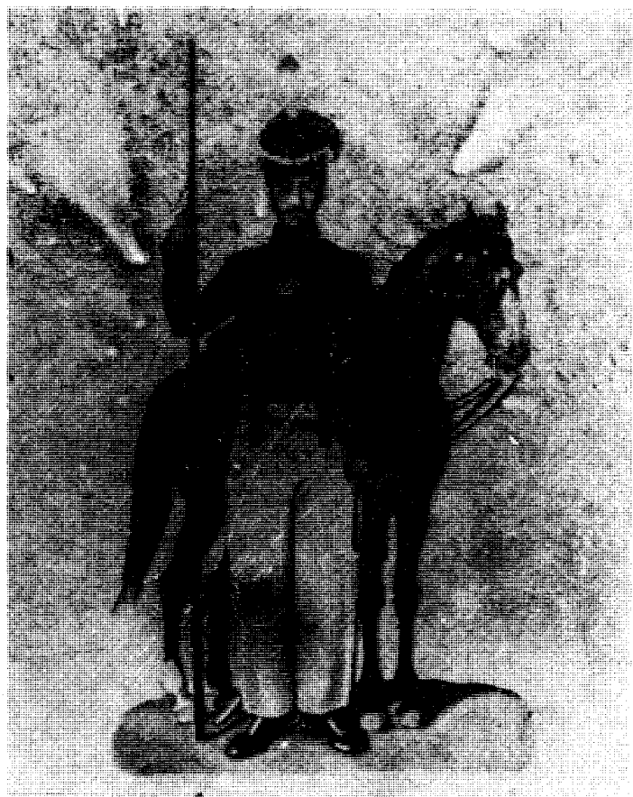
Војник, »Сербског казачког полка« 1813. По опису француског конзула Давида Акварел П. Васића