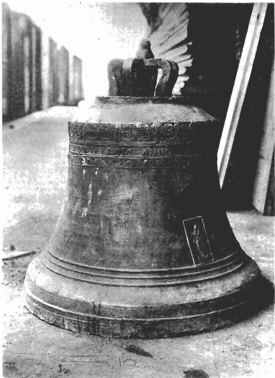
Звоно које је Јоан Фогараси излио у Пакрању 1813. године за цркву у Великој