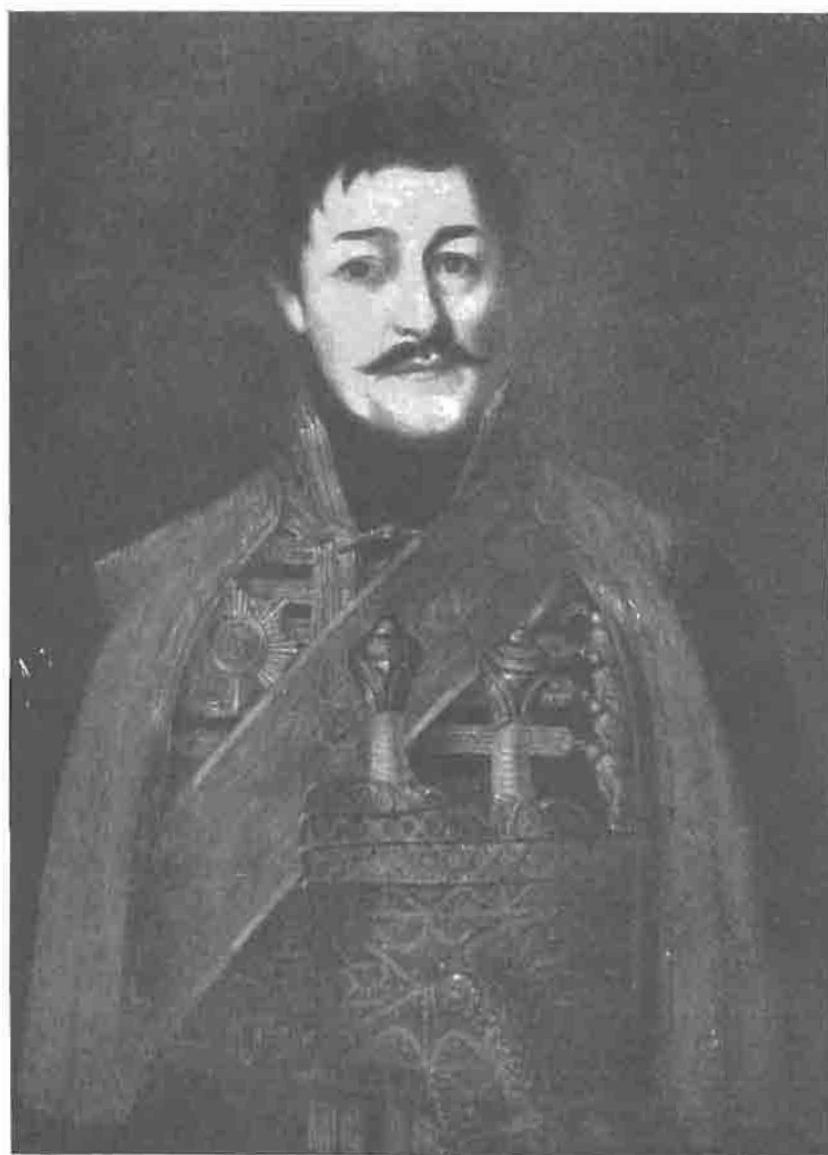
Сл. 2 Јован Поповић, Карађорђе