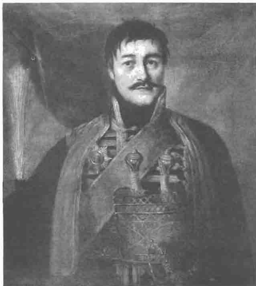
Сл. 4 В. Ј. Боровиковски (?), Карађорђе