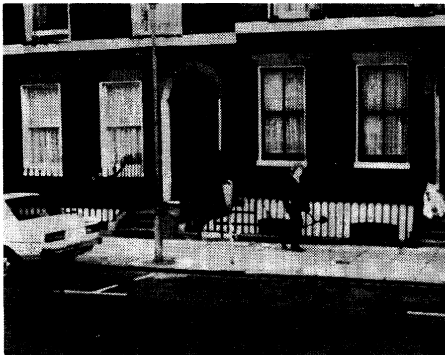
Зграда у Bernard Street-у — посљедњи стан Душана Поповића

дону настали су његови најважнији политички памфлети, објављени у енглеској и у француској социјалистичкој штампи крајем првог свјетског рата.