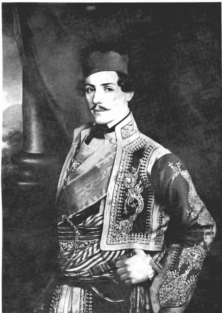
Јован Поповић: Кнез Михаило Обреновић (Својина Народног музеја, Београд)