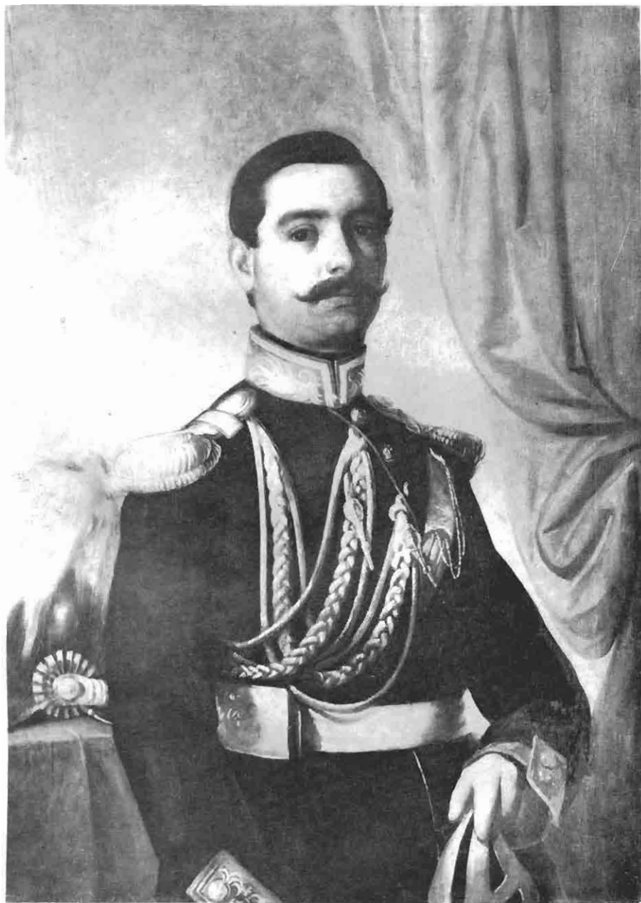
Ђура Јакшић: Поручник Варјачић, ађутант кнеза Михаила Обреновића (Својина Народног музеја, Београд)