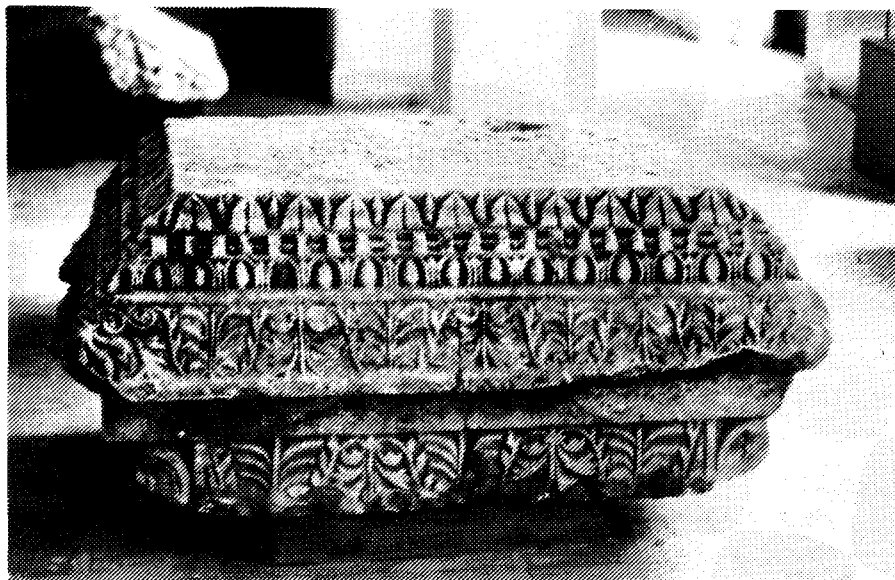
Круниште надгробне аре пронађено на локалитету Градац у Петрову пољу

Најзанимљивији налаз који потиче из села Градац је круниште надгробне аре, случајно ископано 1979. године недалеко од сеоске школе. Круниште је украшено са два реда палмета и по једним редом јонске и лезбоске киме. Украс иде дуж три стране овог четвороугаоног каменог блока чији се профил постепено сужава према доле, док је четврта страна једнако профилисана али без украса готово као да та страна у гробном ареалу није ни требала да буде изложена погледима. Круниште завршава правоугаоником који лево и десно има додатке попут јастучића. Јастучићи на предњој страни имају по