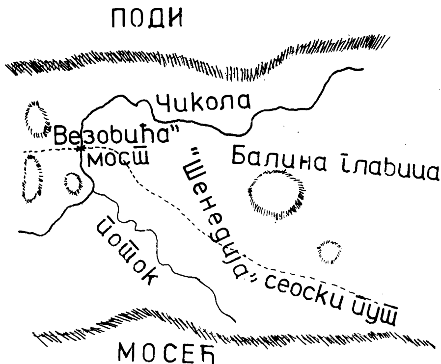
Скица подручја града Municipium Magnum